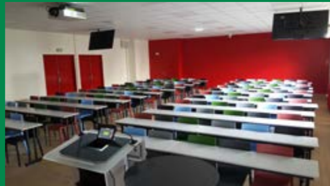
Salle de formation «Quinine»

et VOUS équipez les salles de formation.