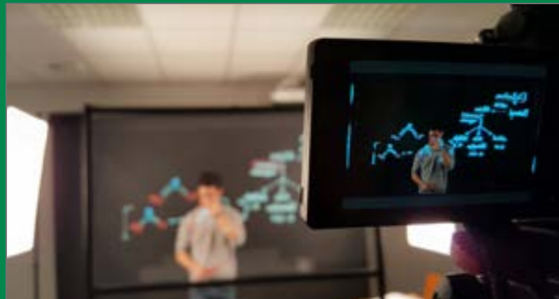
Projet pédagogique «LightBoard»