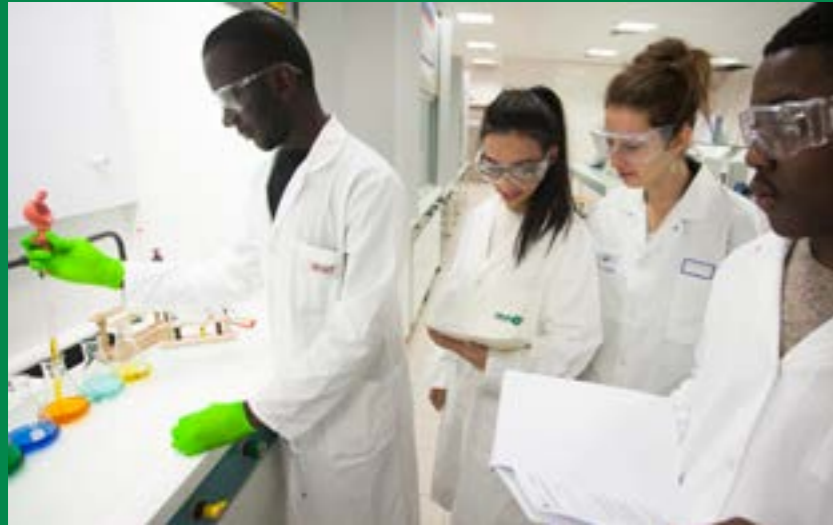
Travaux pratiques de chimie